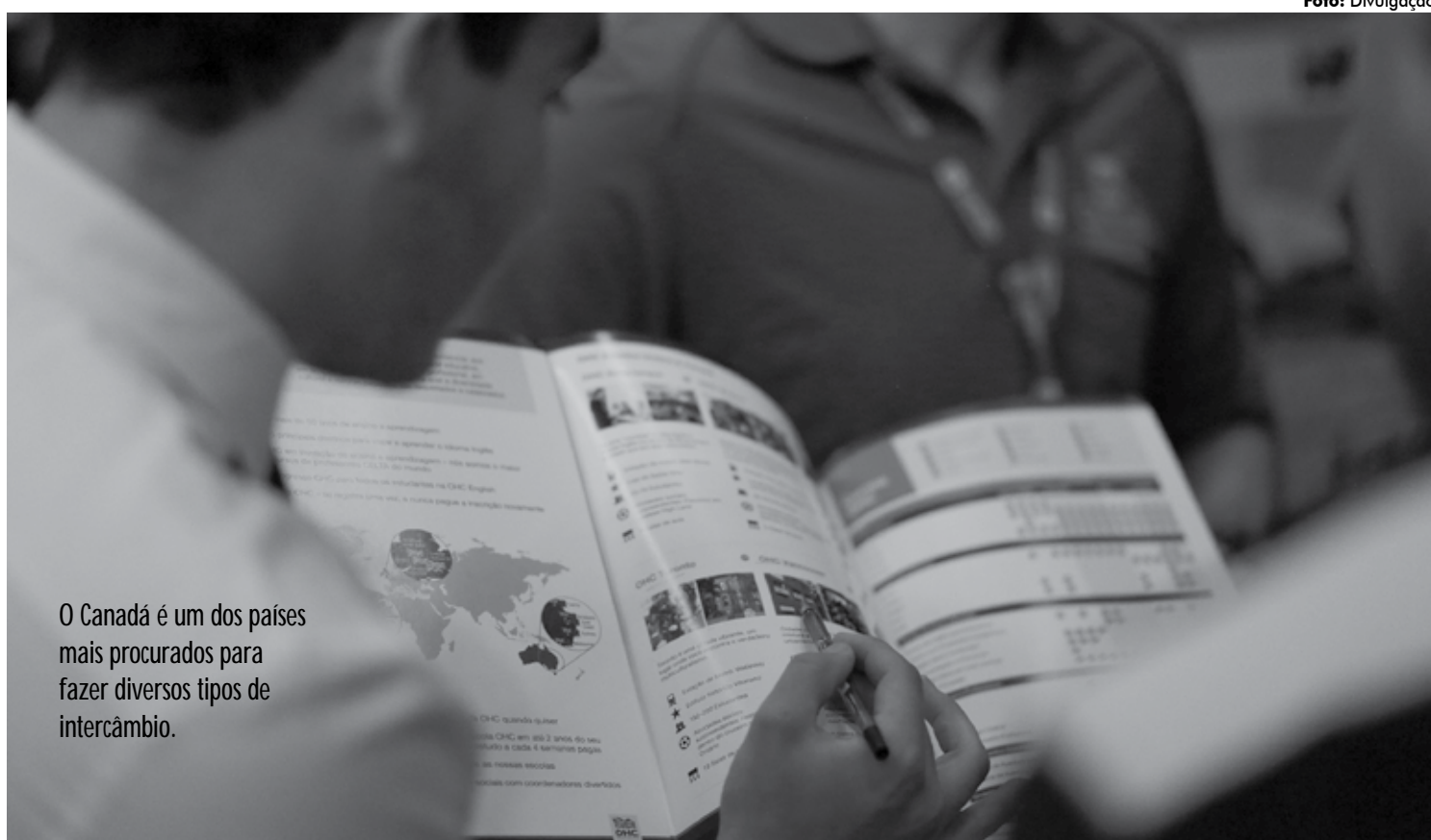
O Canadá é um dos países mais procurados para fazer diversos tipos de intercâmbio.

A feira é aberta a pessoas de todas as idades, que queira conhecer programas e formas de atuar no país