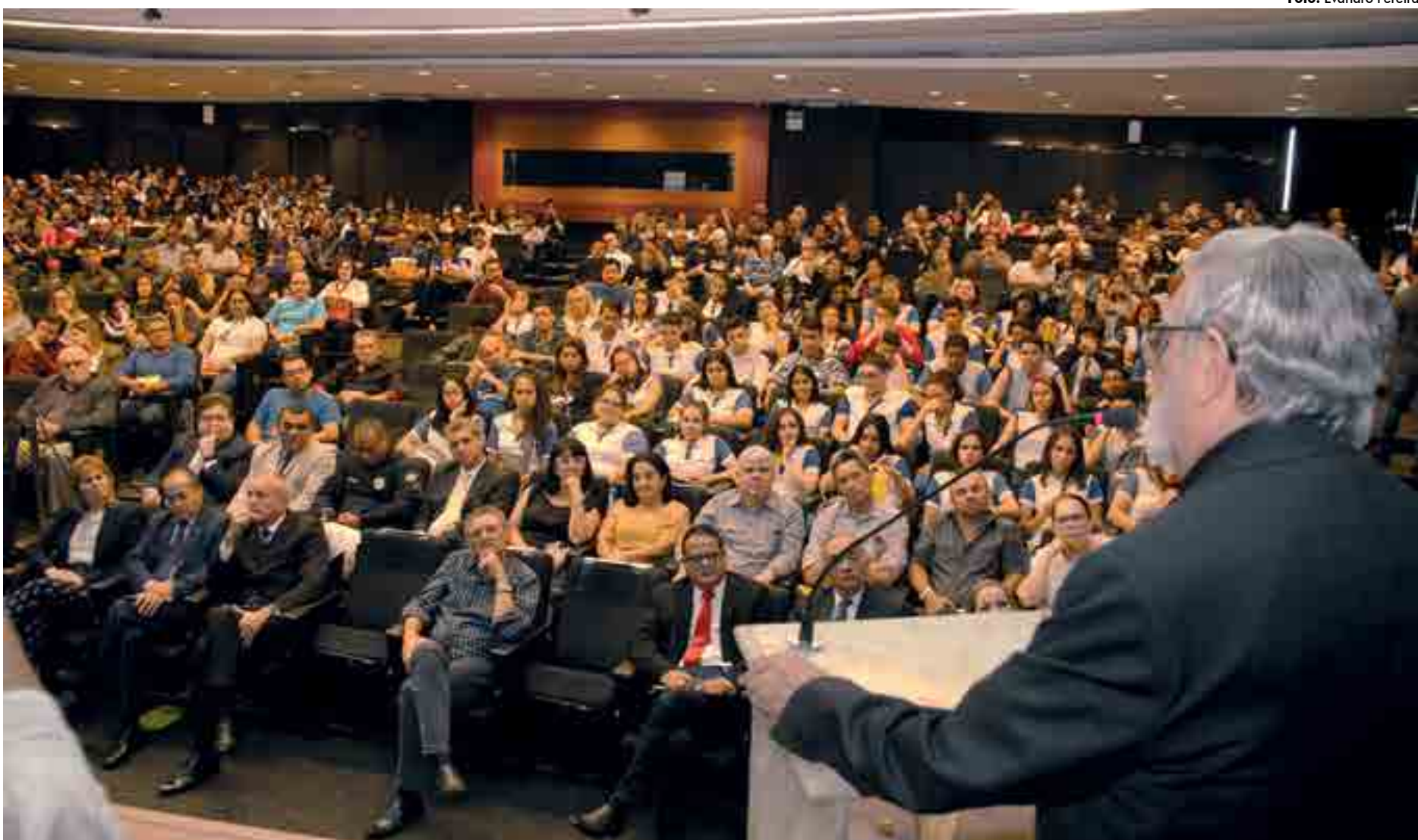
Palestrantes criticaram medidas do Governo que podem provocar o aumento de acidentes, como a não obrigatoriedade da cadeirinha para crianças e retirada dos simuladores nas aulas de direção