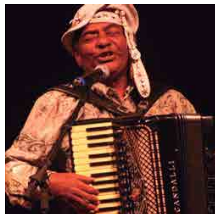
Carreira de Pinto do Acordeon na PB credenciou o músico para o título

Natural do Município de Conceição do Piancó, localizado na região do Alto Sertão do Estado, Pinto do Acordeon é autor de vários sucessos, inclusive em âmbito nacional, gravados por vários artistas, a exemplo de Elba Ramalho, o grupo Os Gonzagas, Fagner, Dominguinhas e Genival Lacerda. E, recentemente, o Estado também reconheceu a sua obra como Patrimônio Artístico Imaterial