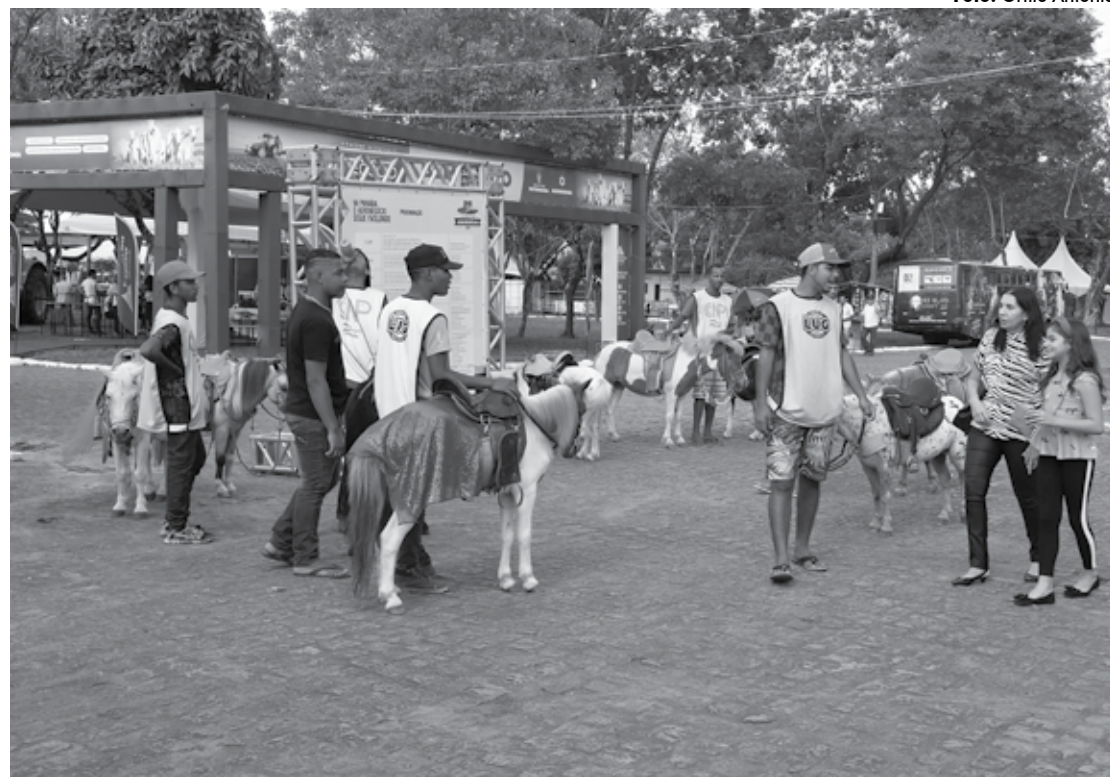
Concurso de bovinos foi a atração desta quarta-feira do evento que é referência para todo o país. Enquanto isso, as crianças podem se divertir apreciando os pôneis que ficam circulando nos espaços da feira