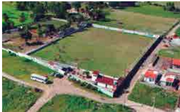
Estádio Tadeuzão, em Sapé, onde o Confiança realiza os seus jogos