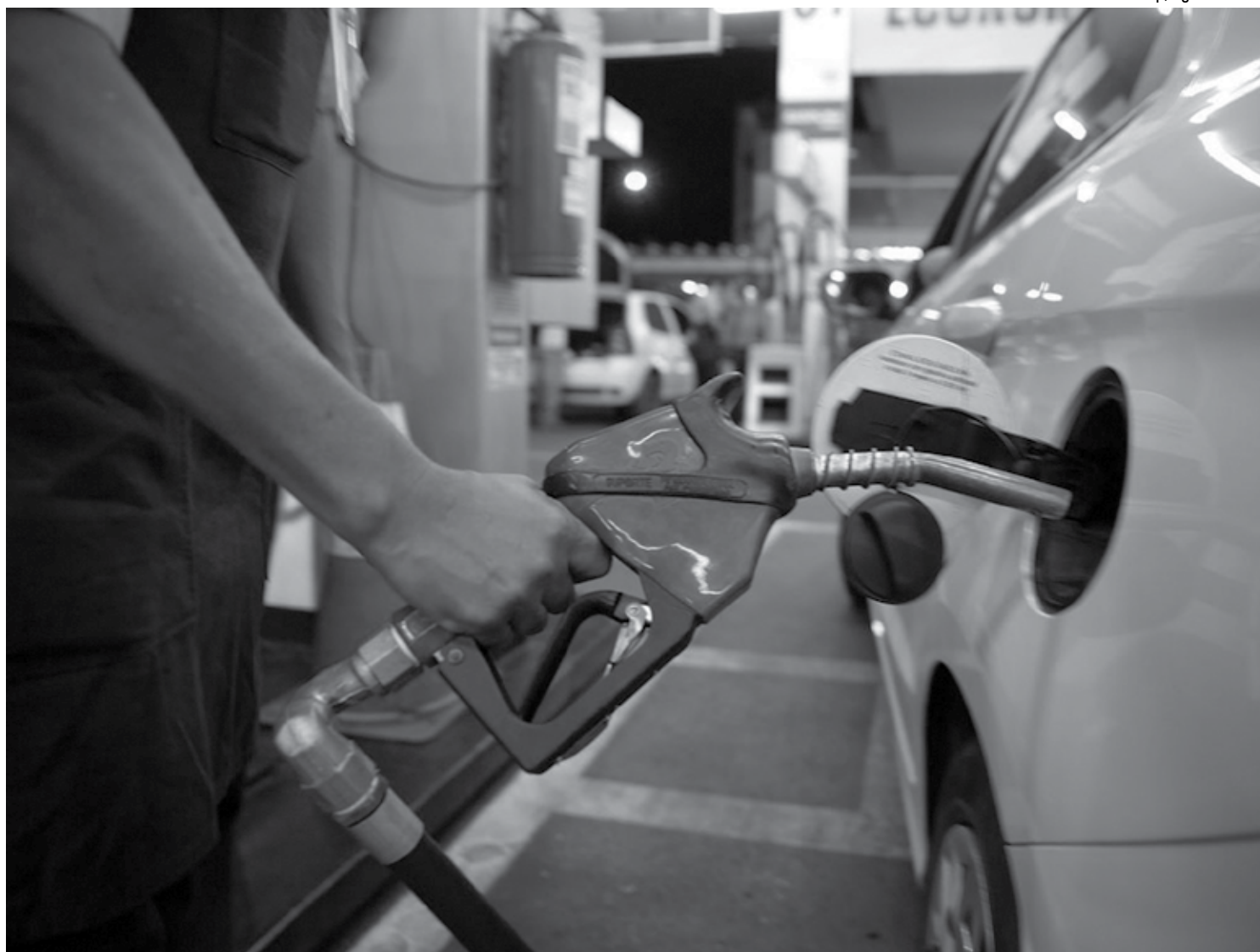
Os postos notificados têm 10 dias para prestar esclarecimentos sobre o aumento repentino nos valores da gasolina e do diesel desde anteontem