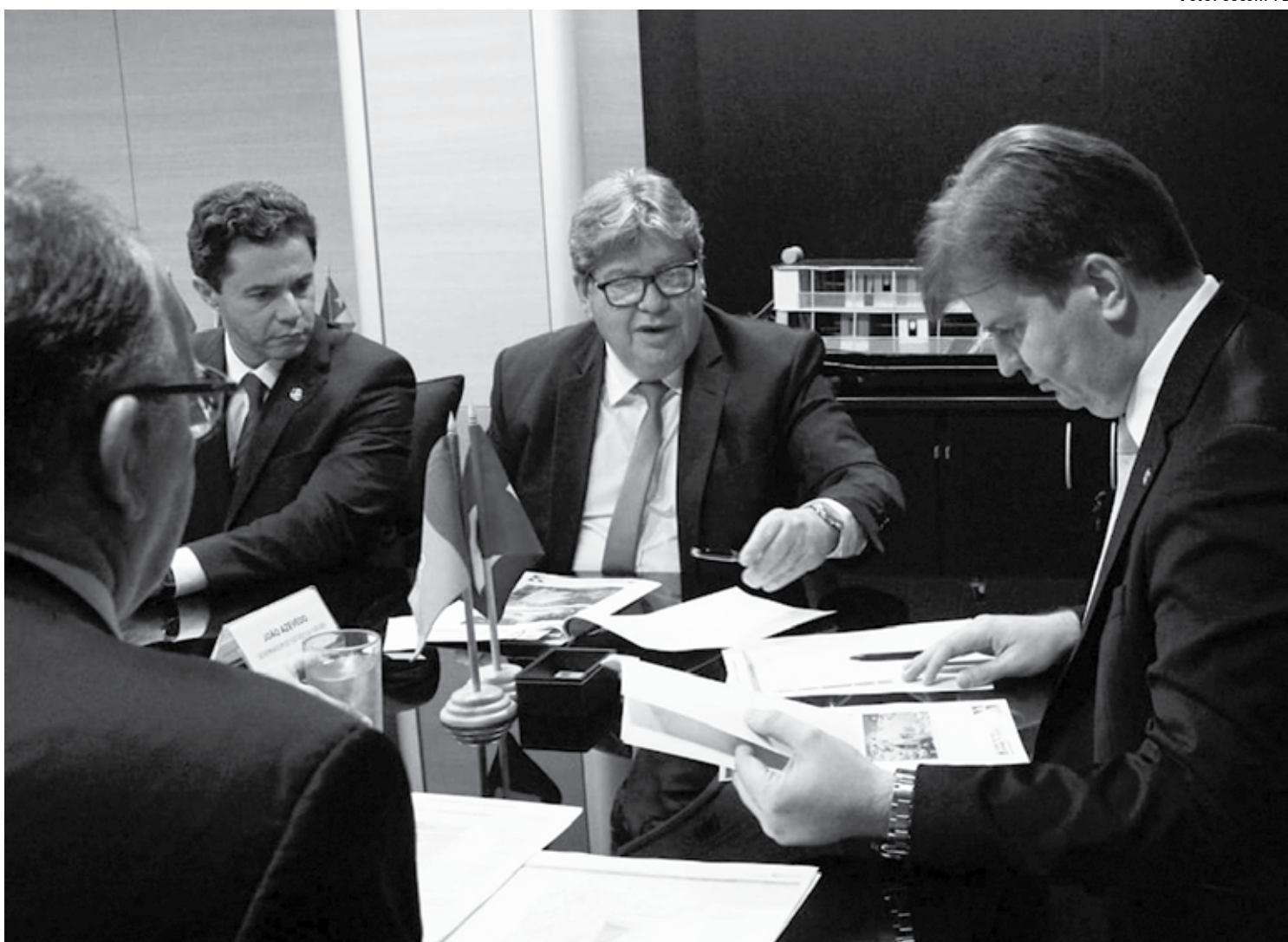
João Azevêdo também assegurou liberação de recursos para sistemas de abastecimento de água das comunidades localizadas até 5 Km do Eixo da Transposição